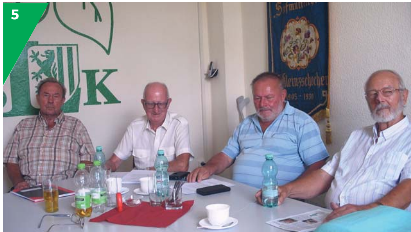
Die Schlichtergruppe des SLK braucht dringend Verstärkung.