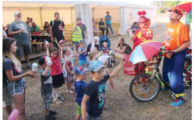
120 Jahre „Naturheilverein Leipzig III“: Kinder sind immer gute Mitspieler.