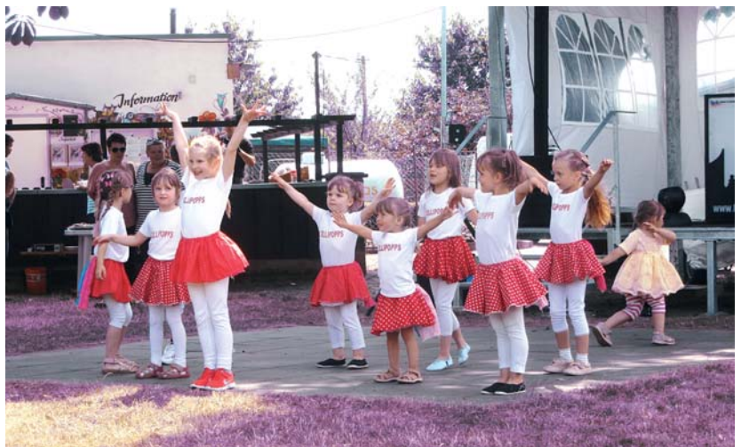
Die eigens engagierte Kindertanzgruppe kam im KGV „Sommerheim“ gut an.