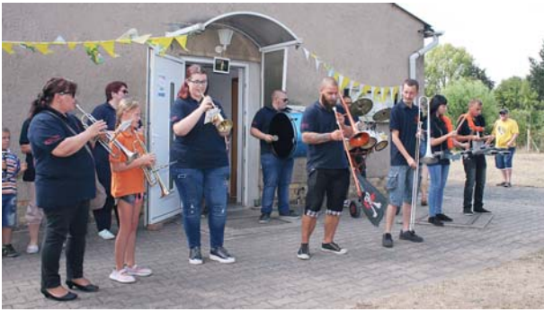
„Stünzer Hain“: Musik muss nicht unbedingt von Profis kommen.