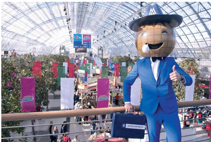
Der Spezialtipp des Messemännchens: Bringen Sie etwas mehr Zeit mit, es gibt wieder eine Menge zu entdecken.

Ob kleinere oder größere Modernisierungsvorhaben, wichtig ist es, sich vorab genau zu informieren und Angebote zu vergleichen. Über 500 Aussteller aus dem Bereich „Modernisieren, Sanieren und Bauen“ stellen ihre Produkte und Angebote vor und beraten. Sie bieten einen Gesamtüberblick über die Branche und laden zum Testen und zum direkten Vergleich ein.