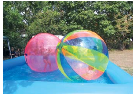
Ungewöhnlicher Wasserspaß für Kinder im KGV „An der Dammstraße“.