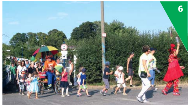
Umzüge sind eine gute Tradition in vielen KGV.