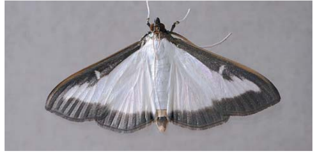
Der gefürchtete Buchsbaumzünsler als Raupe und erwachsener Schmetterling.