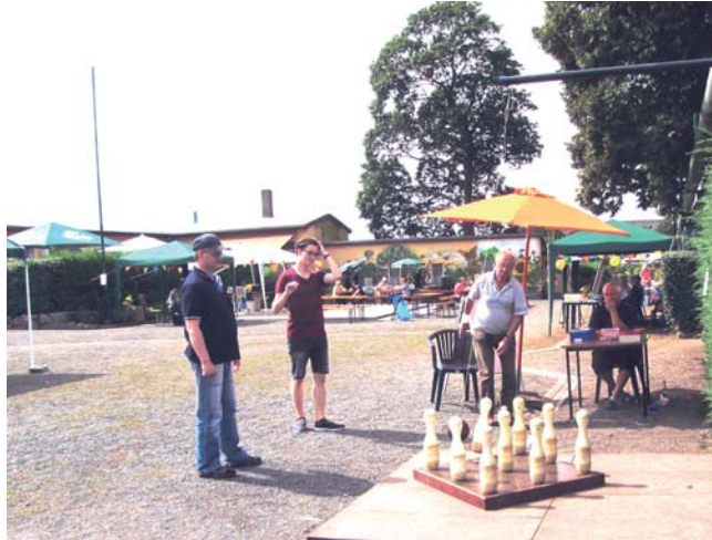
Standbetreuung beim Sommerfest ist eine gute Einsatzmöglichkeit für ältere Vereinsmitglieder im Rahmen der Gemeinschaftsarbeit.

Bei genauem Hinsehen wird deutlich: Es geht immer um Arbeiten, die das Funktionieren des Vereins sichern. Deswegen ist die Bezeichnung Gemeinschaftsarbeit die bessere und zutreffende Benennung dieser wichtigen Vereinsarbeit. Es ist ganz einfach Arbeit für den Verein, die mit Beschluss der Satzung zur Pflicht für jedes Mitglied wird. Gemeinschaftsarbeit ist somit ein