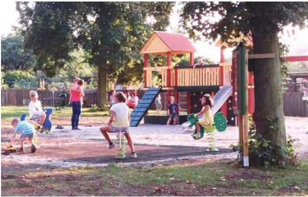
Öffnung und Durchwegung der KGA, Ruhezonen und Kinderspielfläche können einige „Bausteine für den Leuchtturm“ KGV sein.