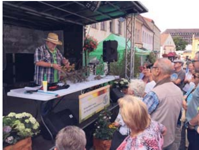
Der Fachmann zeigt, wie's geht.

Die Torgauerin, die sich selbst als Gartenfanatikerin bezeichnet, hat zu Hause ganz frisch gekaufte Apfel-, Mirabellen-, Pfirsich- und Kiwibäume stehen, bei denen im nächsten Jahr ein Baumschnitt fällig ist. Erworben hat sie die Pflanzen beim Gärtner ihres Vertrauens und damit hat sie alles richtig ge-