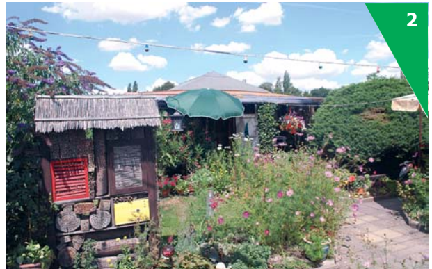
Vielfältige naturnahe Gartengestaltung ist eine solide Grundlage für die Entwicklung des KGV zu einem „Leuchtturm“.