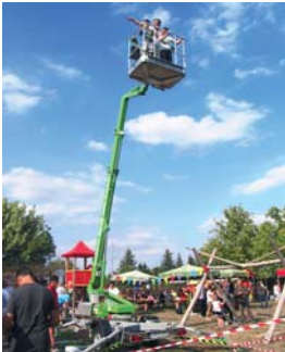
Der Blick von oben ist immer eine gute Idee.

Pünktlich zum Herbstbeginn ging dem unendlich erscheinenden Sommer 2018 dann doch die Puste aus. Die Redaktion nimmt das zum Anlass, zurückzublicken auf die Kinder- und Sommerfeste, die in vielen Kleingärtnervereinen noch immer eine gute Tradition sind. So fanden z.B. in den Monaten Juli und August in mehr als 50 Vereinen solche Höhepunkte statt. Da wir leider nicht von allen berichten konnten, soll diese kleine Bildauswahl an die schöne Zeit der Kinder- und Sommerfeste erinnern und schon Appetit auf die Veranstaltungen im kommenden Jahr machen.