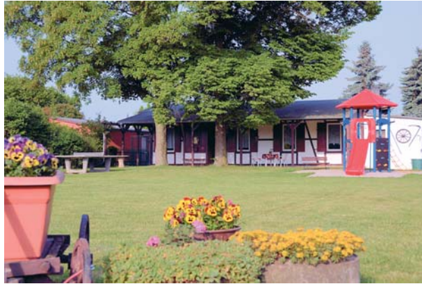
Die Vereinswiese mit Spielplatz und Vereinshaus.

Im KGV gab es ein buntes und vielfältiges Vereinsleben. Es wurden fast jeden Monat Feste gefeiert. Ab 1911 wurden Festumzüge organisiert, die vom vereinseigenen Trommler- und Pfeifenkorps