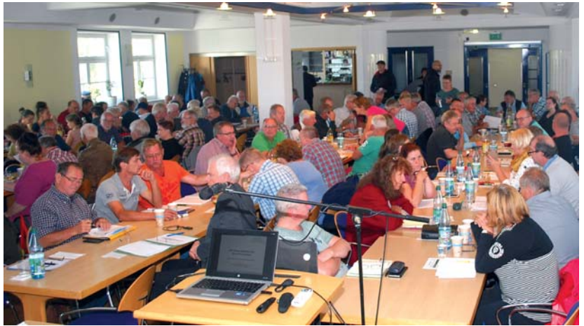
Über 200 Personen nahmen am Seminar des Stadtverbandes teil.

Unabhängig davon sind die KGV gut beraten, sich jetzt schon Gedanken darüber zu machen, was in den nächsten Jahren getan werden sollte, um ihren Verein im Sinne des „Masterplanes Grün Leipzig 2030“ zu einem „Leuchtturm“ werden zu lassen. gm