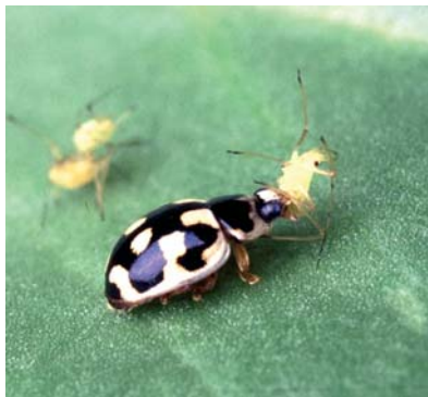
Ein 14-Punkt-Marienkäfer lässt sich eine Blattlaus schmecken.

Die immense Bedeutung der Insekten und ihre unglaubliche Vielfalt werden von uns Menschen kaum wahrgenommen und nur selten gewürdigt. Die schiere Arten-Übermacht von (in Deutschland) etwa 175 Tagfalterarten, 3.000 Nachtschmetterlings-, 6.000 Käfer-, je 80 verschiedenen Libellen- und Heuschrecken-, je 1.000 Wanzen- und