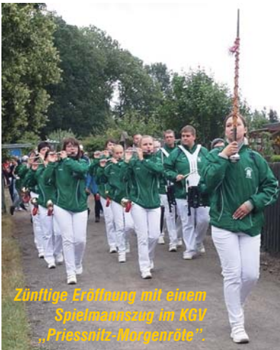
Zünftige Eröffnung mit einem Spielmannszug im KGV „Priesnitz-Morgenröte“.