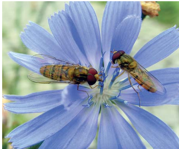
Gedeckter Tisch im naturnahen Garten: Schwebfliegen auf der Blüte einer Wegwarte.

Hier einige Anregungen für Ihre Teilnahme am Wettbewerb: Mitmachen kann jeder Kleingärtner, der in Leipzig eine Parzelle gepachtet hat. Die Bewerbungsunterlagen müssen bis 30. April 2018 beim ASG vorliegen. Bewertungskriterien sind u.a. das Verhältnis versiegelte/unversiegelte Fläche, die Strukturvielfalt, eine Kompostanlage, die Regenwassernutzung, der Verzicht auf Pestizide, die Vielfalt der Nutzpflanzen, das Verhältnis von Rasen-, Beet- und Blühflächen, die Verwendung von Pflanzen, die heimischen Insekten, Vögel usw. dienen. Teilnahmevoraussetzung ist die Einhaltung des