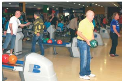
Jetzt anmelden und als Mannschaft beim Bowling Cup punkten!

Wer dabei sein will, sollte in seinem Kleingärtnerverein möglichst bald die Werbetrommel rühren und eine Mannschaft auf die Beine stellen. Jedes Team besteht aus vier Aktiven, das Startgeld beträgt pro Person 13 Euro (inklusive aller Spiele, Leihschuhe, Preisgelder und Cosmic-Bowling bis zur Siegerehrung). Jeder Spieler absolviert drei Spiele und sollte ca. zweieinhalb Stunden Zeit „mitbringen“.