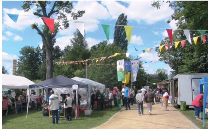
Veranstaltungen und Vereinsfeste haben traditionell einen festen Platz im Terminkalender des Vereins. Im Bild: das Kinder- und Sommerfest 2017.

Ab 1898 kam die soziale Kinderbetreuung dazu. Dafür wurden geeignete Flächen gepachtet. Darunter war 1905 auch ein Grundstück an der Theresienstraße. Da der Pachtvertrag nur bis 1908 befristet war, musste ein neues Objekt gesucht werden. Am 1. Oktober 1908 wurde vom Gutsbesitzer Hermann Hahn ein 30.000 m 2 großes Grundstück gepachtet. Das reichte für 145 Familiengärten, ein Luftbad und einen Spielplatz. Am 11. März 1909 erfolgte die Eintragung ins Vereins-