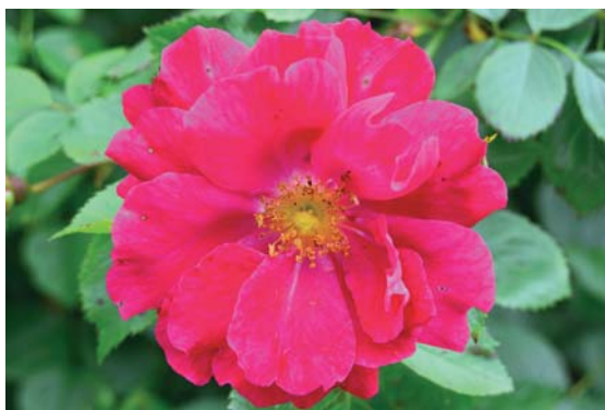
Die Kletterrose „Flammentanz“ ist ein Klassiker mit ADR-Siegel seit 1952.

Um die „inneren Werte“ einer Rose zu erkennen, sind Experten gefragt. Das ADR-Prädikat (Allgemeine Deutsche Rosenneuheitenprüfung) ist wie eine TÜV-Plakette für Autos. Nur gesunde Rosen dürfen die begehrte Auszeichnung tragen. Sie ist daher beim Rosenkauf eine gute Orientierungshilfe.