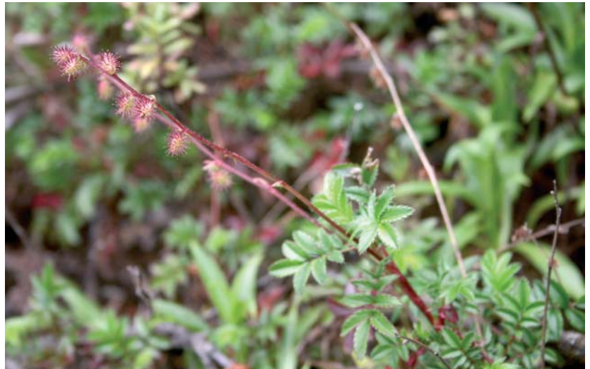
Stachelnüsschen stellen geringe Ansprüche an den Boden.

Die Pflanzen bilden einen dichten, strapazierfähigen Rasen. Der richtige Platz sind Felsenritzen, Flächen zwischen Trittplatten oder mageren Böschungen. Auch selten gegossene Gräber sind geeignet. Zwiebelblumen können mit Stachelnüsschen vergesellschaftet werden. Die Ansprüche an den Boden sind sehr gering. Die Pflanzen benötigen weder Pflanzenschutzmittel, Dünger noch Wassergaben. An einem sonnigen Standort entwickeln sich Stachelnüsschen besonders gut. Bo-