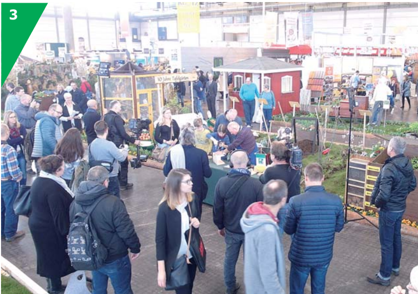
Der Messestand der Leipziger Kleingärtner in Halle 1 – hier während einer Sondervorführung zum Nistkastenbau – war ein Anziehungspunkt für zahlreiche Besucher.

Menge Fragen rund um den Garten zu beantworten. Besonders interessiert betrachteten viele Messebesucher ein Hochbeet, das als Frühbeet gestaltet war, bei dem auch der innere Aufbau sehr deutlich demonstriert wurde.