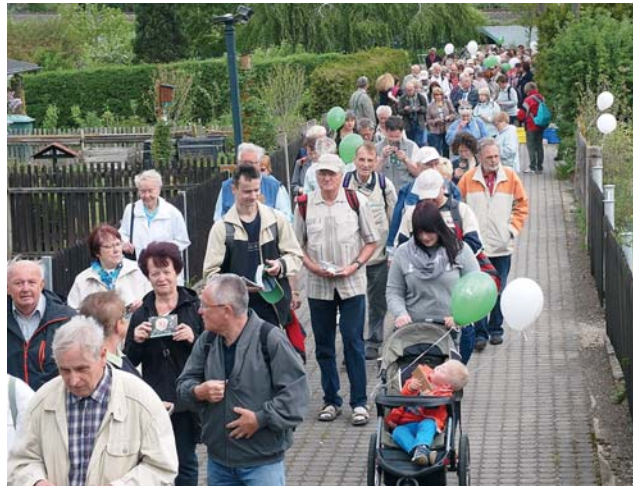
Die Wanderung durch Leipziger Kleingartenanlagen hat sich als familienfreundliche Veranstaltung für Groß und Klein etabliert.

Auch die beliebten Wertmarken für eine Grillkost von der Generali Versicherung und ein Getränk, vom Grünflächenamt gesponsert, gab es beim ersten Zieleinlauf in der