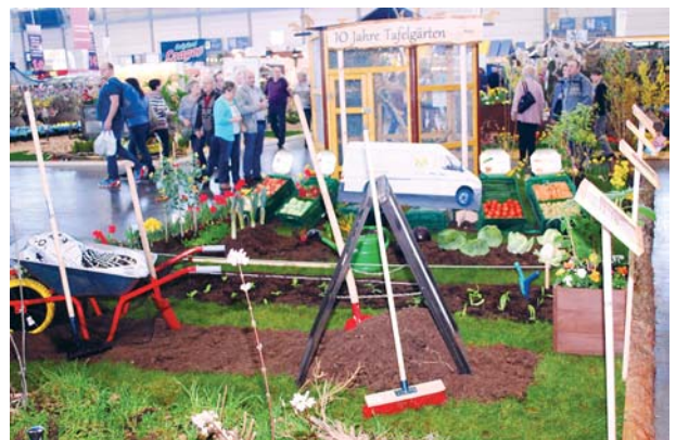
Vom verwilderten Garten zum leistungsfähigen Tafelgarten: Das war deutlich dargestellt.