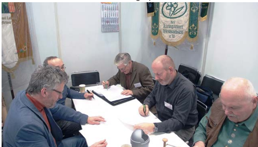
Die Redaktionsrunde des „Leipziger Gartenfreundes“ bei ihrer Beratung auf dem Messestand der Leipziger Kleingärtnerverbände.