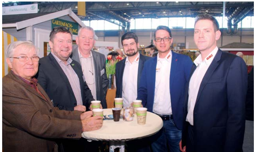
Die Chefs der Leipziger OBI-Märkte (rechts) nahmen sich Zeit für ein Gespräch am Messestand der beiden Kleingärtnerverbände.

Im Mittelpunkt des Messeauftritts stand erneut die Gartenfachberatung. Die Spezialisten beider Kleingärtnerverbände hatten jede