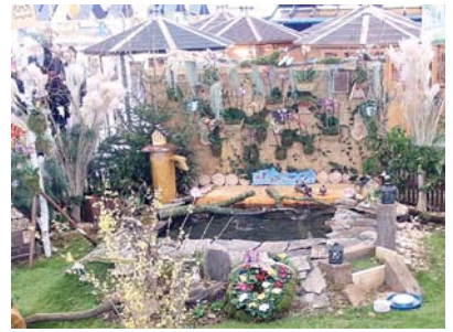
Der Teichbereich wurde neu gestaltet.

Weiteres Wissenswertes konnten die Besucher am Stand der Leipziger Kleingärtner erfahren. Dazu waren u.a. der Sächsische Qualitätskartoffelverband, der Botanische Garten für Arznei- und Gewürzpflanzen Großpösna-Oberholz, der Imker Garrelt von Eshen, die Vogelschutzlehrstätte des SLK, die