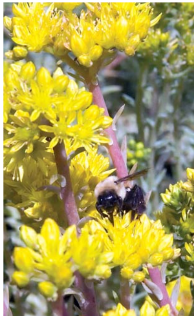
Fette Henne (mit Hummel) in voller Blüte.

Wenn Sie auf der Messe sind, bringen Sie Ihre „Alte Abwrack-Gartenschere“ direkt mit und erhalten auf Gartenpaul Gartenscheren Sonderpreise. Sie finden uns in - Halle 1 | Stand E25 -