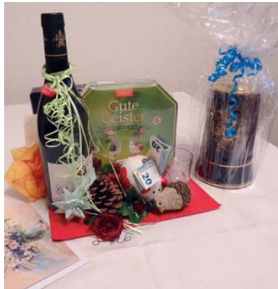
Ein Dankeschön für 30 Jahre Wirken in der Fachberatung.

Bereits im Februar des Jahres 1984, als wieder Neuwahlen stattfanden, wurde ich Vereinsmitglied und als Fachberater in den Vorstand gewählt. Damals konnte ich noch nicht ahnen, dass sieben Jahre später Hobby und Beruf mein weiteres Leben prägen sollten. Als unser damaliger Vorsitzender im