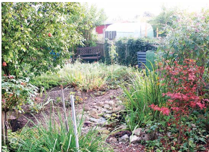
Naturnahes Gärtnern bedeutet, weg vom „aufgeräumten“ hin zum naturnahen, artenreichen Garten.

Umso wichtiger ist die Erhaltungsfunktion der Kleingärten. Sie sind Refugien für viele bedrohte Arten in der Tier- und Pflanzenwelt. In Sachsen werden ca. 9.000 Hektar als Kleingärten bewirtschaftet. Mit viel-