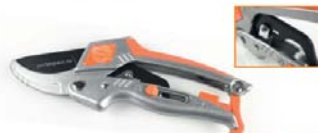
Ratsche 2.0 „Ratsch & Roll“