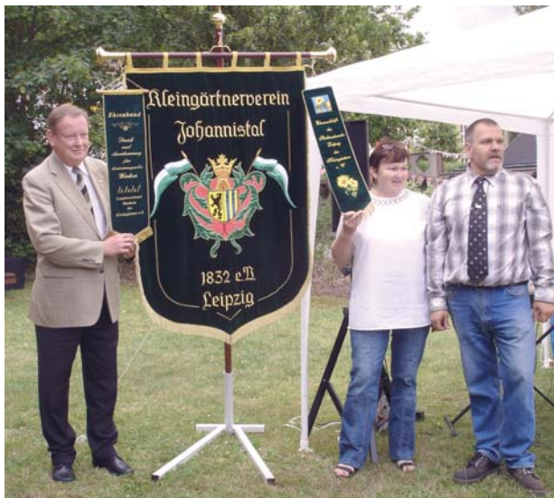
Fahnenweihe im „Johannistal“ im Rahmen der Veranstaltung anlässlich des 175-jährigen Bestehens des Vereins.