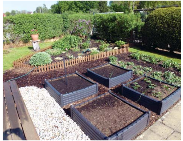
In den gut gepflegten und meist intensiv bewirtschafteten Gärten sind viele Hochbeeten anzutreffen.