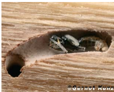
Der Fraßgang des Ungleichen Holzbohrers.

jahresbefall beachten) werden mindestens acht Fallen/ha aufgehängt und zwei bis dreimal pro Woche neu gefüllt. Bei kühler Witterung ist ein Abstand von zwei Wochen ausreichend. Nach starken Niederschlägen (Verdünnung!) muss die gesamte Lockstoffflüssigkeit ausgewechselt werden. Die letzten Käfer werden in der Regel Mitte Juni gefangen. Um unnötige Fänge von Nützlingen zu vermeiden, sollten die Fallen sofort nach Ende des Fluges abgehängt werden.