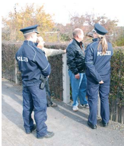
Anlagenbegehungen mit Vertretern des Ordnungsamtes und der Polizei sind eine wertvolle Hilfe.

Die Entwicklung und Festigung des Sicherheitsgefühls der Vereinsmitglieder ist deshalb eine wesentliche Aufgabe der Vorstände. Vor allem ist zu klären, dass Sicherheit in der KGA alle angeht und jeder seinen Anteil dazu erbringen muss. Dabei geht es um den Schutz des Gemeinschaftseigentums genauso wie um den Schutz des Privatei-