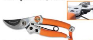
Bypass Gartenschere „Lady“

Ratsche 2.0 32,00 = 25,- R1 29,95 = 20,- Ratsche Premium 29,95 = 20,- Lady 19,95 = 15,-