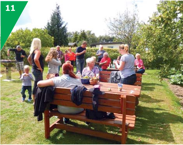
Der Fachberater-Stammtisch findet während der Gartensaison jeweils am 2. Sonntag im Monat statt.