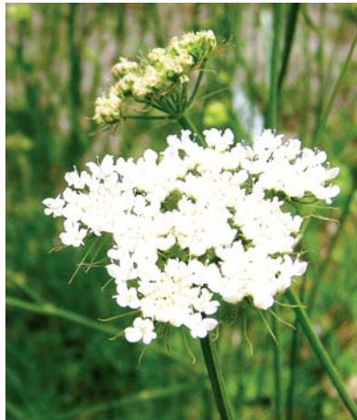
Blühende Erdkastanie.

Eine Pflege der Pflanzen ist kaum nötig. Geerntet und genutzt werden