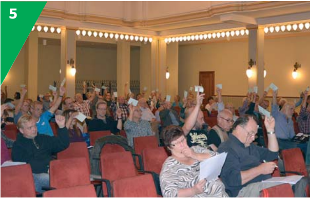
Die Entlastung des bisherigen Vorstandes und Wahl des neuen erfolgten mit sehr großer Mehrheit.