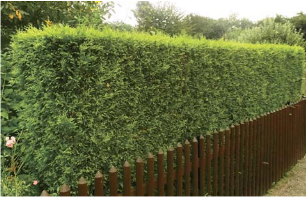
Diese Hecke ist eindeutig zu hoch.