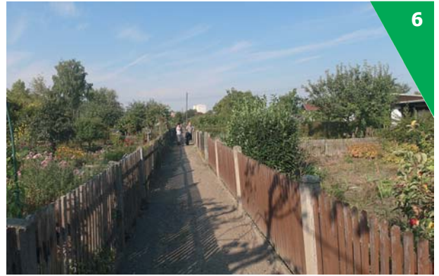
Ein vorbildlicher Zwischenzaun (rechts im Bild).