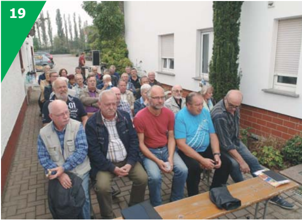
Die wissbegierigen Fachberater im „Klassenzimmer“.