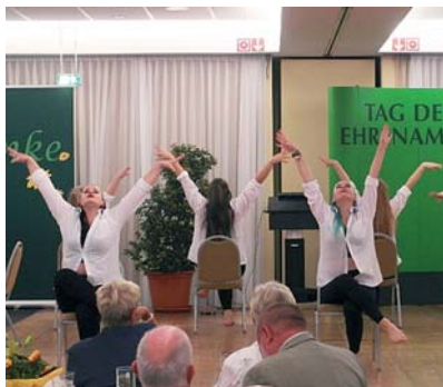
Die „Silhouette de la Mademioselle“ bekommen viel Beifall.