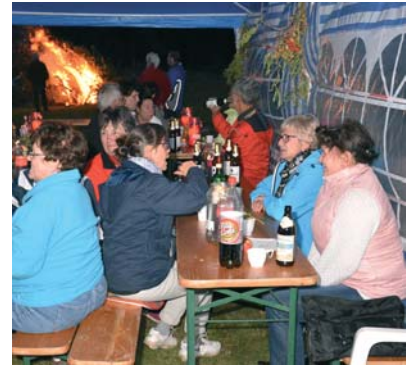
Links: In der Anlage gibt es Hecken statt Zäune. Oben: Geselligkeit gehört zum Vereinsleben.