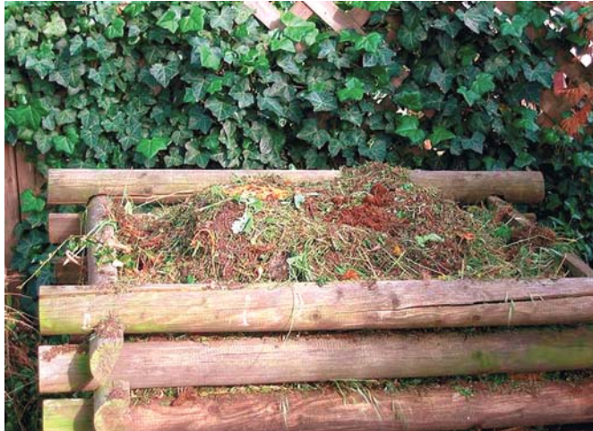
Ein Kompost sollte in keinem Kleingarten fehlen.

die organische Substanz und die in ihr gespeicherten Pflanzennährstoffe in den Naturkreislauf zurückzuführen und die positiven Wirkungen des Humus auf den Boden und Pflanze gezielt zu nutzen. Man beachte auch, dass der Kompost