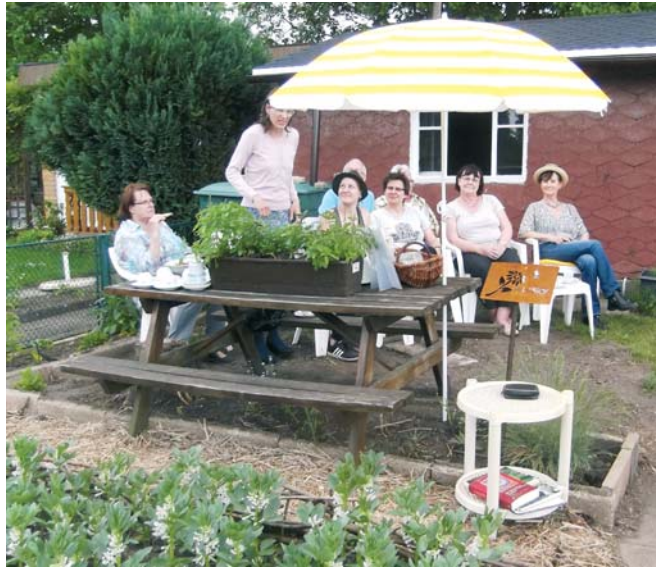
Die Eröffnung des Kräutergartens am 20. Mai 2017.

Die Bepflanzung wurde mit alten Pflanzensorten sowie mit Neuzüch-