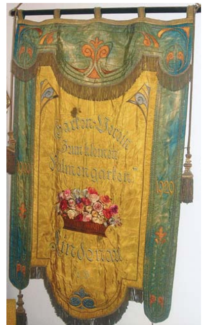
Die Vorderseite der Fahne.

Heute stellen wir die Vereinsfahne des KGV „Kleiner Palmengarten“ vor. Der Verein ist in der Lützenstraße 138-140, in 04179 Leipzig, ansässig und wurde 1909 gegründet. Die Vereinsfahne hatten Frauen des KGV angefertigt und mit einem schönen Text auf der Rückseite versehen. -r