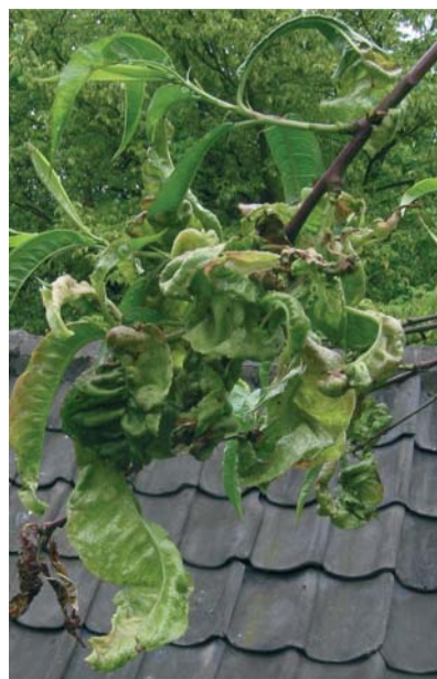
Kräuselkrankheit im fortgeschrittenen Stadium am Pfirsich.

Sehr wichtig: In Haus- und Kleingärten dürfen ohne Sachkundennachweis ausschließlich Pflanzenschutzmittel eingesetzt werden, die