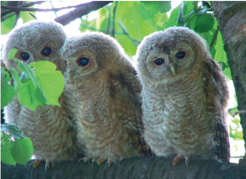
Drei junge Waldkäuze.