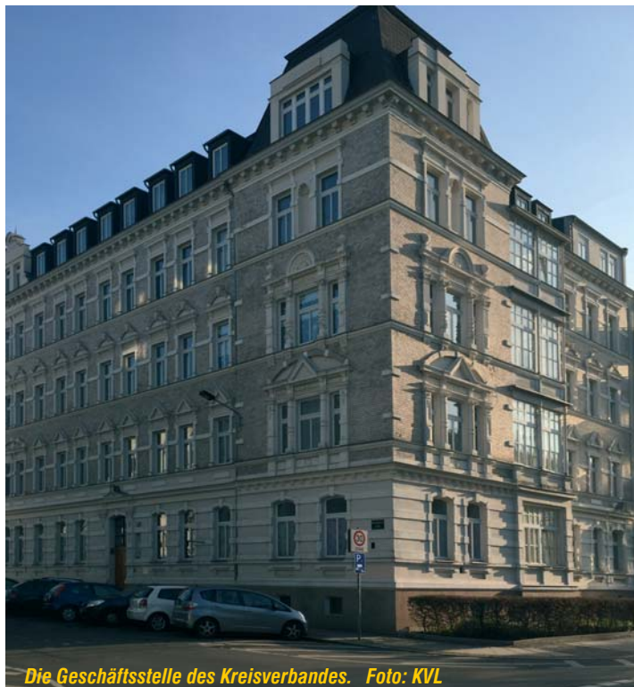
Die Geschäftsstelle des Kreisverbandes.