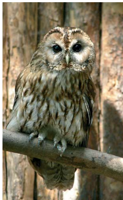
Ein ausgewachsener Waldkauz.