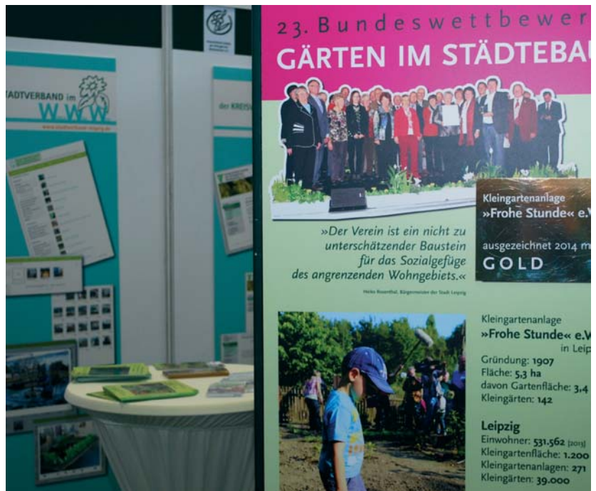
Die Teilnahme an Messen wie der „Haus-Garten-Freizeit“ ist auch eine wirksame Methode der Öffentlichkeitsarbeit.

wurden z.B. im Jahr 2015 in 43 Kleingärtnervereinen und 2016 in 52 Vereinen Anlagenbegehungen durch den Vorstand des Stadtverbandes sowie jährlich etwa sieben Begehungen der Gartenfachkommission des SLK durchgeführt),