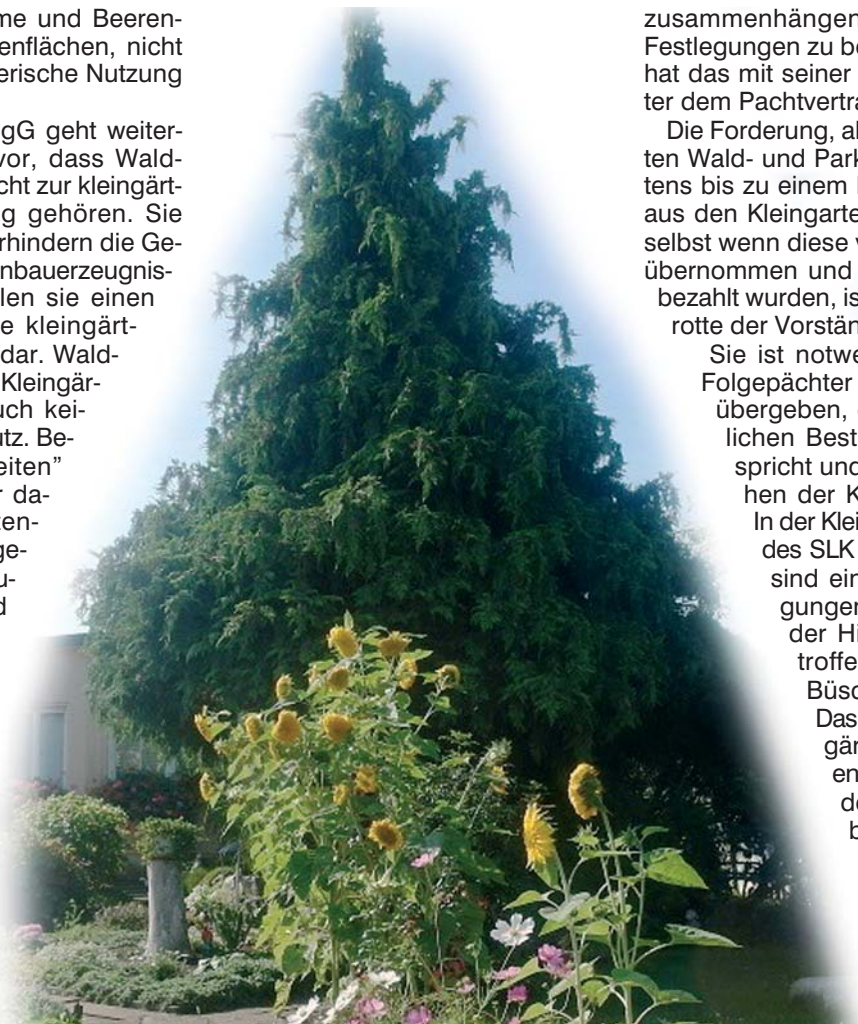
Gefährliche Romantik: Solche Bäume in der Parzelle beeinträchtigen die kleingärtnerische Nutzung und können das Fortbestehen der Kleingartenanlage gefährden.

Dabei macht übrigens auch die Stadtverwaltung keine Ausnahme. Im Zusammenhang mit der wachsenden Einwohnerzahl benötigt die Stadt Leipzig dringend Flächen für Wohn- und Verkehrsbauten. Einzelne Bürger haben angesichts der ca. 270 Kleingartenanlagen in der Stadt auch schon die Frage aufgeworfen, ob es denn sooo viele sein müssten. Bisher hat die Stadtverwaltung das mit dem Beitrag der Kleingärtner zur Verbesserung der