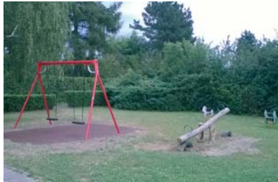
Unser Spielplatz – nun vom TÜV akzeptiert.

Im August 2015 hatten wir auf Grund häufiger Einbrüche im Vereinshaus Fördermittel für den Einsatz technischer Präventionsmittel beantragt. Auf Anraten der Arbeitsgruppe „Sicherheit in Kleingärten“ des Kommunalen Präventionsrates der Stadt beantragten wir den Bau einer Beleuchtungseinrichtung für unseren Hauptweg, der vom Amt für Stadtgrün und Gewässer bewilligt wurde. Auch für unseren Spiel-