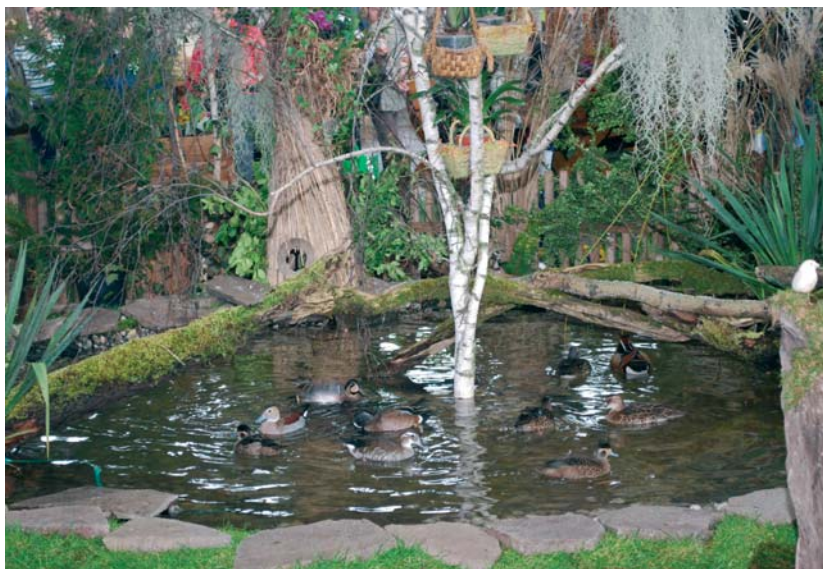
Ein traditioneller Blickfang am Messestand ist der Ententeich – in diesem Jahr trotz Vogelgrippe hoffentlich erneut mit Enten.

Verschiedene Apfelsorten können täglich (außer am 14. und 16. Februar) verkostet werden. Natürlich nur, solange der Vorrat reicht. Zeitiges Kommen sichert eine reiche Auswahl!