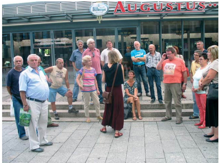
Exkursionen sind eine gute Tradition der Bezirksgruppe. Das Foto zeigt die BZG bei einer Führung auf dem Uni-Campus am Augustusplatz.

Über das Problem „Strom abstellen im Winter“ gab es recht unterschiedliche Auffassungen. Das muss jeder KGV aus seiner Sicht regeln und mit einem Beschluss der Mitgliederversammlung festlegen, war die abschließende Meinung dazu.