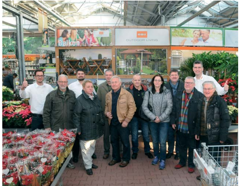
So sehen Sieger aus: Die Preisträger unseres Gewinnspiels im OBI-Markt am Hauptbahnhof.

Die Endauslosung fand am 17. Dezember im OBI-Baumarkt am Hauptbahnhof bei Kaffee und Stollen statt. Mit von der Partie waren die Chefs der drei Leipziger OBI-