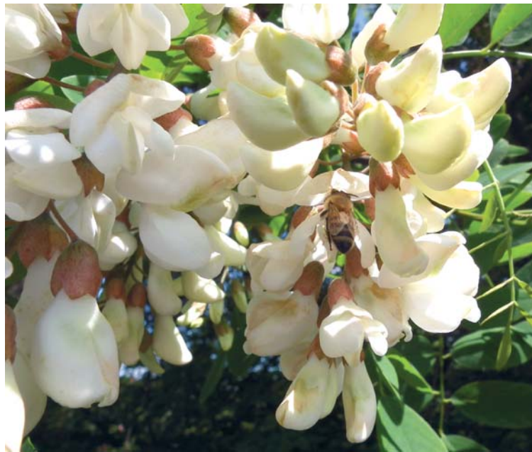
Die Blüten der Robinie liefern Bienen und anderen Insekten Nahrung.

Die Robinie blüht und fruchtet schon mit sechs bis sieben Jahren und damit früher als andere Bäume. Aus den weitreichenden Wurzeln treibt die Wurzelbrut stark aus, so dass bereits