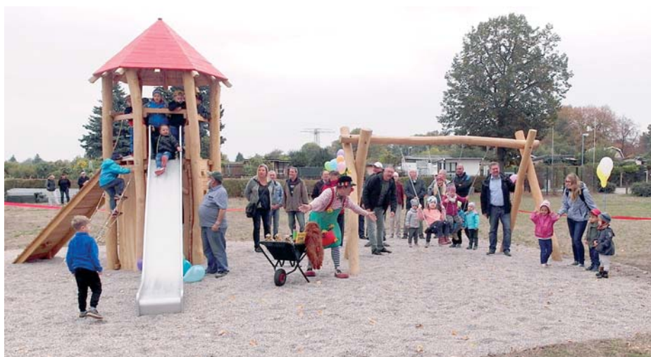
Zur familienfreundlichen Gestaltung der KGA gehört auch ein Spielplatz.

Die bekannten Themen des Masterplans – Gesundheit, Klimaanpassung, Umweltgerechtigkeit, Biodiversität, umweltgerechte Mobilität – waren die Leitthemen der Beratung. Unter diesen Gesichtspunkten informierten die Teilnehmer über ihre Ziele und Vorstellungen für die Zukunft ihres