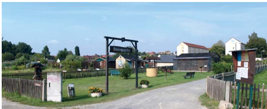
Der Erholungsgarten am Hauptweg der Anlage des KGV „Mockau-Mitte“.

Am 15. Oktober 1936 wurde eine Satzung angenommen und der Verein am 28. November 1936 beim Amtsgericht angemeldet. Zu diesem Zeitpunkt gehörten 100 Gärten auf einer Fläche von 35.500 m 2 zu diesem Verein. 1937 verpachtete die Stadt Leipzig weitere Flurstücke zum Abnaundorfer Park hin an den Verein, der weitere 68 Parzellen daraus machte. Sie wurden auch auf dem Teil des