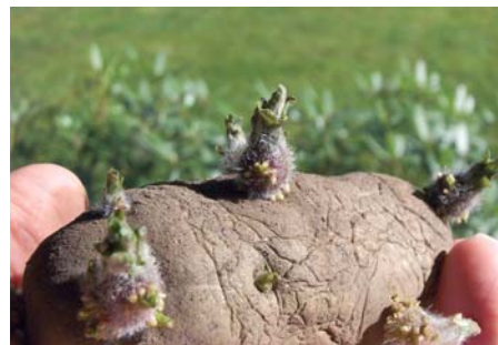
Vorgekeimte Kartoffel gedeihen am besten.

Gemüsegarten: In den letzten Jahren habe ich gute Erfahrungen beim Vorziehen meiner Bohnen gemacht. Da Bohnen sehr kälteempfindlich sind, ziehe ich meine (auch Stangenbohnen) in kleinen Töpfen im Gewächshaus vor. Wer keines hat, kann die Fensterbank nutzen. Je nach Größe der Töpfe gebe ich fünf Samen hinein und lasse die Triebe 15 cm hoch wachsen. Nach den Eisheiligen werden die Sämlinge ins Freie in gleichen Abständen gesetzt, damit man den Boden dazwischen besser bearbeiten kann.