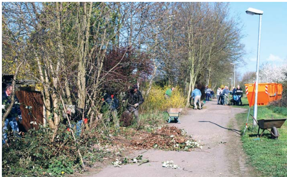
Pflegearbeiten im Umfeld der Anlagen sind ein wichtiges Anliegen beim jährlichen Frühjahrsputz der Leipziger Kleingärtner.

Leider findet sich in illegalen Müllablagerungen im Umfeld einiger Anlagen immer wieder kleingärtnerischer Abfall. Es ist eine alte Weisheit, dass dort, wo Schmutz liegt, mehr dazu kommt. Das ist mit Müllablagerungen genauso. So kommt es, dass beim Frühjahrsputz auch stets Abfälle, die nicht von Kleingärtnern stammen, entsorgt werden müssen. -r