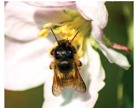
Der Apfelbaum ist Lebensraum und Klimaschutz zugleich.