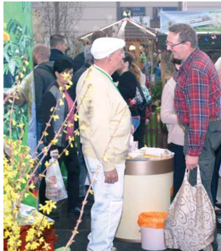
Viele Besucher kamen an den Messestand, um sich zu informieren.